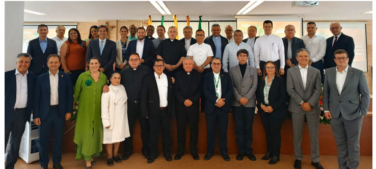
Red de Universidades RUN