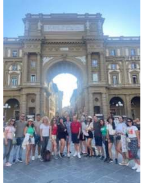
Intersemestral de Arquitectura en Italia